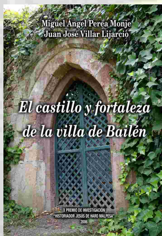
Portada del libro editado del trabajo premiado.