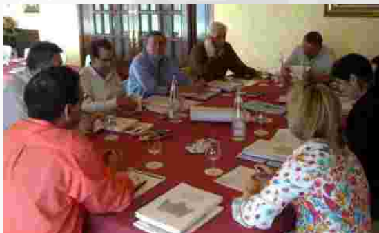
Acto de deliberación del X premio. Reunión del Jurado.