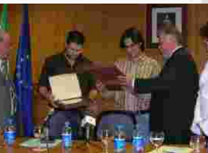
Acto de entrega del X premio a los ganadores del mismo.