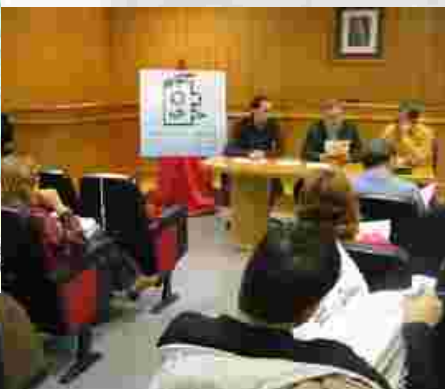
Acto de presentación y entrega a los directores de los centros educativos de Bailén del folleto ilustrado